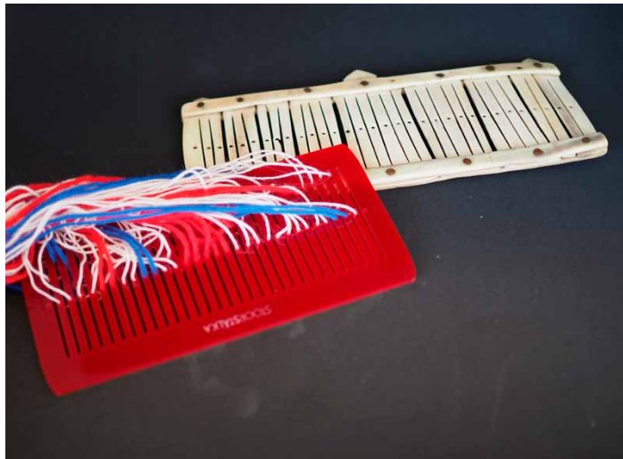
Plastihkkanjuikun (rukses) ja čoarvenjuikun (vilges).