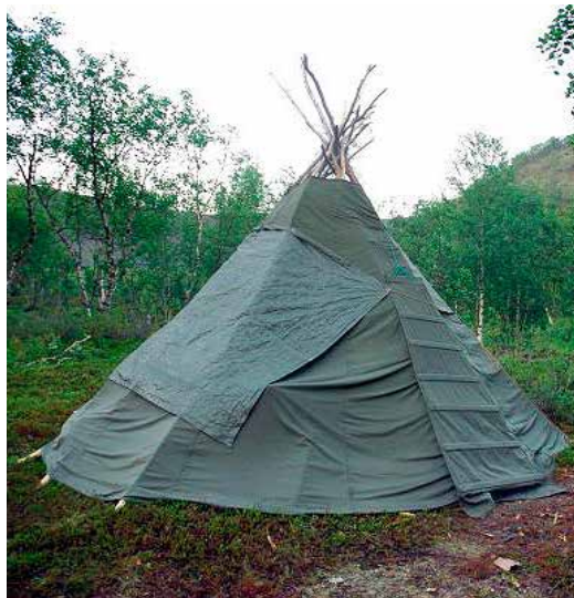
Plastihkkafárju loavdaga alde.