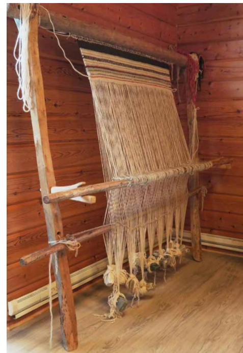
Gákkesstuollu ránuin.

Duodjesearvvi nissonat juogadedje ges eará ovdamearkka mii guoskkai ullo ja árbevirolaš gođdimii, ja mo dat doaibma buvtii ekonomalaš friijavuoda nissoniidda Oimmáivákkis. Dán guovllus, de birgejedje ovdal dál smávvdáallodoallobuktagiin, guollebivdduin ja gođdimiinna. Gákkesstuolud ledje dábbalaččat buot ruovttuin, ja dávjá dat lei gievkkanis vai nissonat besse gođdit go lei bottoš eará barggaid gaska. Báikkálaš ránu gođdin lei dehálaš árbevierru mearrasámiin. Rátnu (Manndalsgrene dahje grene dárogillii) geavahuvvui lonohallangálvun ja lei guovddáš oassi dálodoalo ekonomijjas, erenoamážit dain jagiin go mearrabivdu ii lihkestuvvan. Rátnu geavahuvvui árbevirolaččat loavddan, reagain, gávdnin ja eará vugiin. Rikkis bearrašiin dat atnui maid láhtterátun. Dálá áigge geavahuvvo rátnu eanaš seaidnehearvan. Gáivuona vearjogalba mii bođii 1988 čájeha ge dortte, ja dat govvida dan boares ja beakkán báikkálaš duodjeárbevieru.