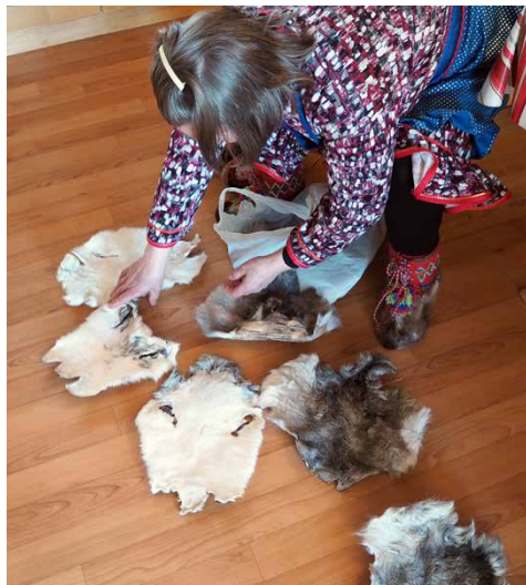
Ávdnasat gállohiidda.