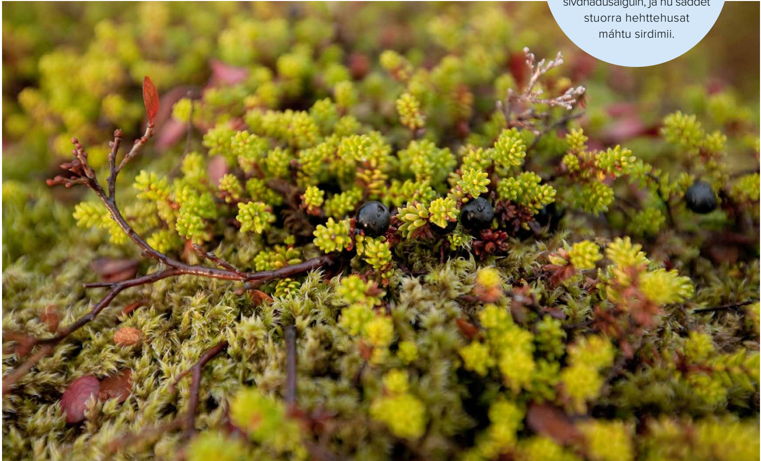
Árktalaš šattut.

Nesheim et al. (2006) ákkastallá ahte olbmuid máhttovuogádagaid rievdadeamit váikkuha sin oktavuhtii eatnamiin ja eará sivdnádušsain, ja nu šaddet stuorra hehttehusat máhtu sirdimii.