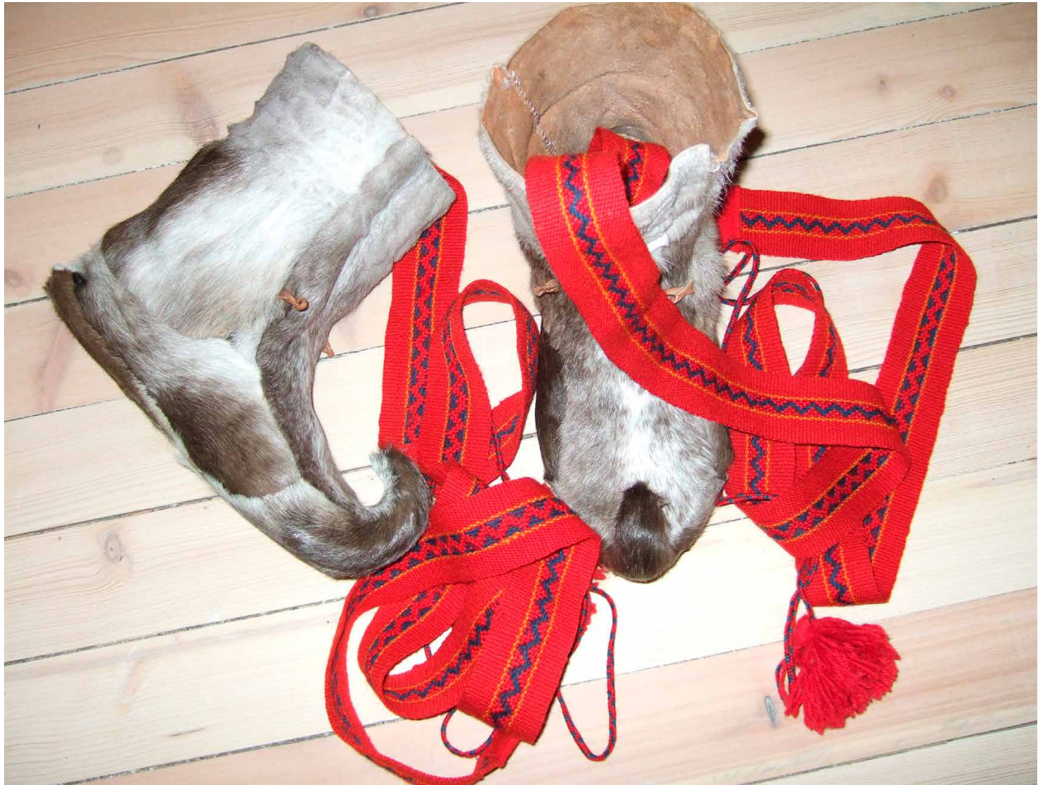
Gállohat , bohccogállonáhkis ja gápmasiin gorrojuvvon gápmagat.