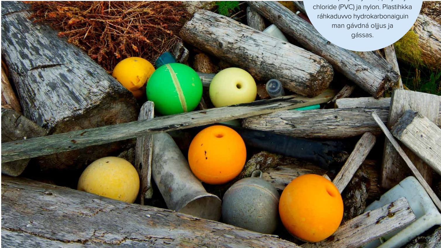
Plastihkkanuoskkideapmi ja riehkít Romssa rittus, Norggas.

Doaba “plastihkka” mearkkaša soddjil ja álki hábmēt. Dán áigái plastihkka eanaš áigge oaivvilda syntehtalaš ávdnasa polymeras dahkkon, nu mo polyethylene, polyvinyl chloride (PVC) ja nylon. Plastihkka ráhkaduvo hydrokarbonaiguin man gávdná oljjus ja gássas.