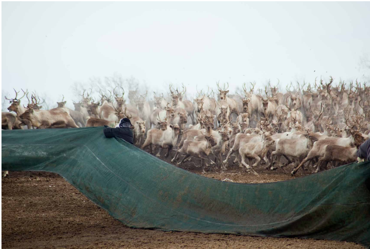
Čohkkemin bohccuid Finnmárkkus, Norway.